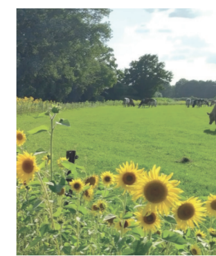
Zonnebloemen aan de akkerrand van de Hiddinkdijk

Van wie is het landschap? Van niemand en van iedereen, en daar schuilt als we niet opletten een gevaar wanneer we het eigenaarschap zo in het midden laten. Iedereen is gebruiker van het landschap. Met name inwoners zijn nauw betrokken op hun landschap.